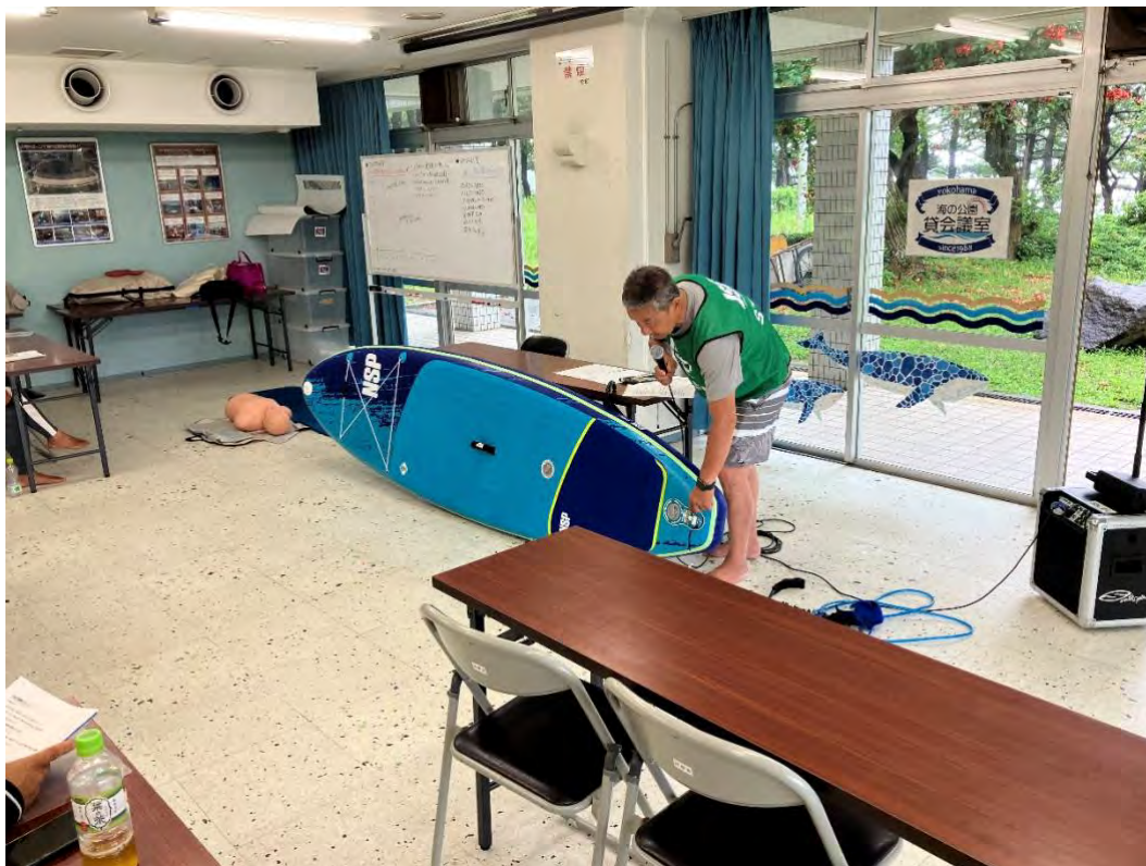
ライフベストについて