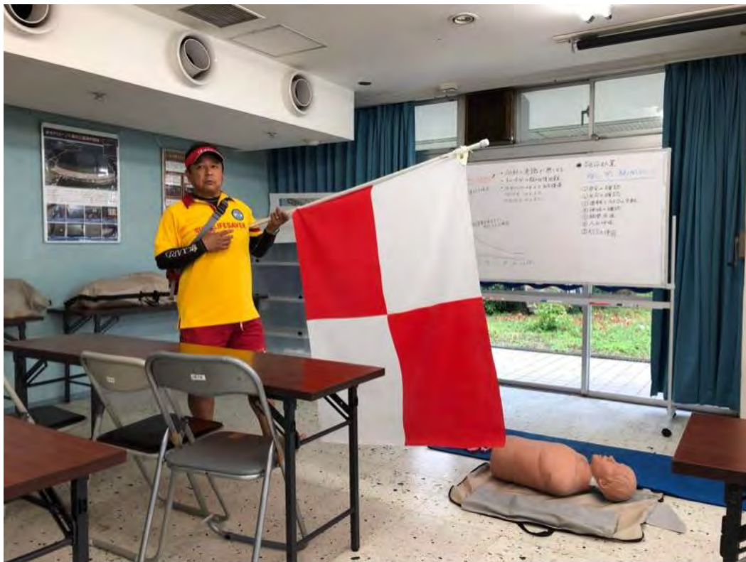
海上講習とギア試乗の様子